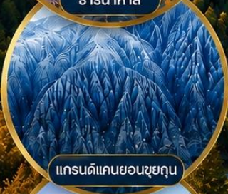
แกรนด์แคนยอนชุยถุน