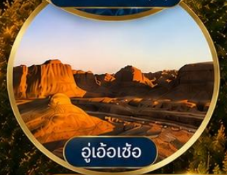
อู่เอ้อเซ่อ