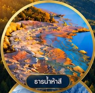
ธารน้ำห้ำสี