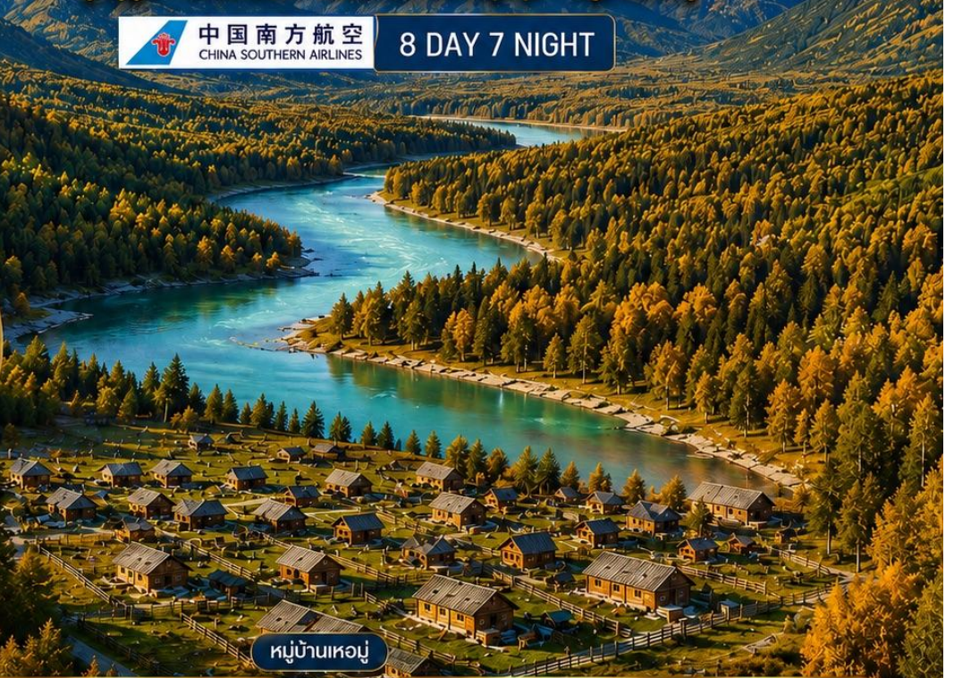
หมู่บ้านเหอมู่