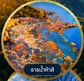
ธารน้ำห้ำสึ