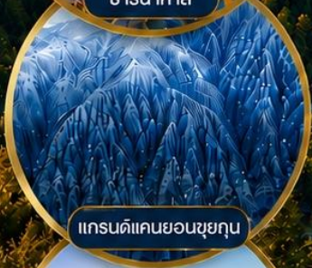
แกรนด์แคนยอนซูยกุน