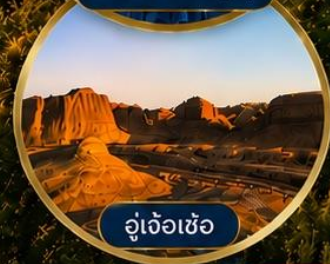
อู่เจ้อเซ่อ